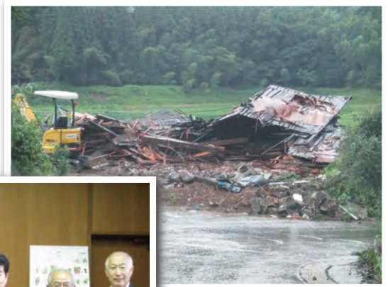
西原村 震災の爪痕 1