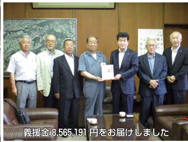
義援金 8,565,191 円をお届けしました