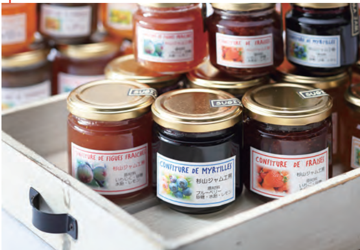
杉山ジャム工房 手作りジャム