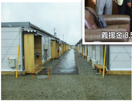
西原村 仮設住宅の様子