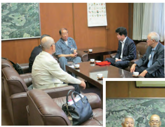
西原村 村長室にて