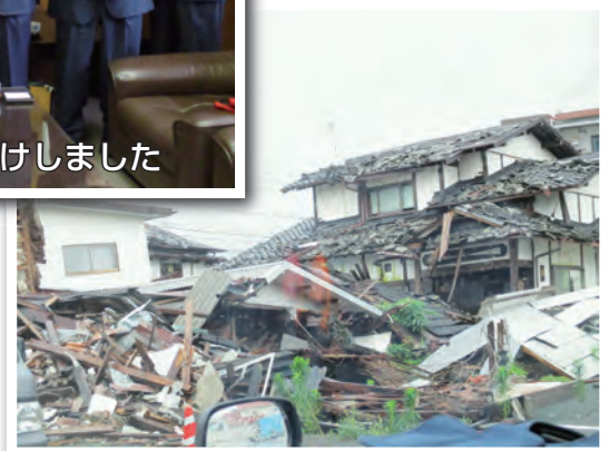
西原村 震災の爪痕 2